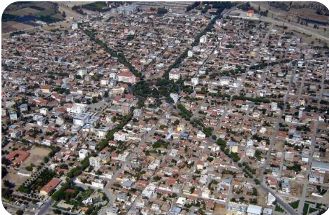
Aydın / Sultanhisar / ATÇA

Dairesel Yerleşmeler: Daire görünümüne bu yerleşmelerde: