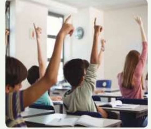
Öğrencilerin sınıf kurallarına uymaları beklenir.