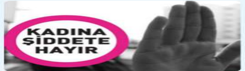
Kadına yönelik şiddetin önlenmesi önemli bir sosyal kontrol sorunudur.