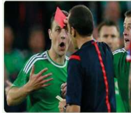
Futbolcuların futbol kurallarına uymaları beklenir.