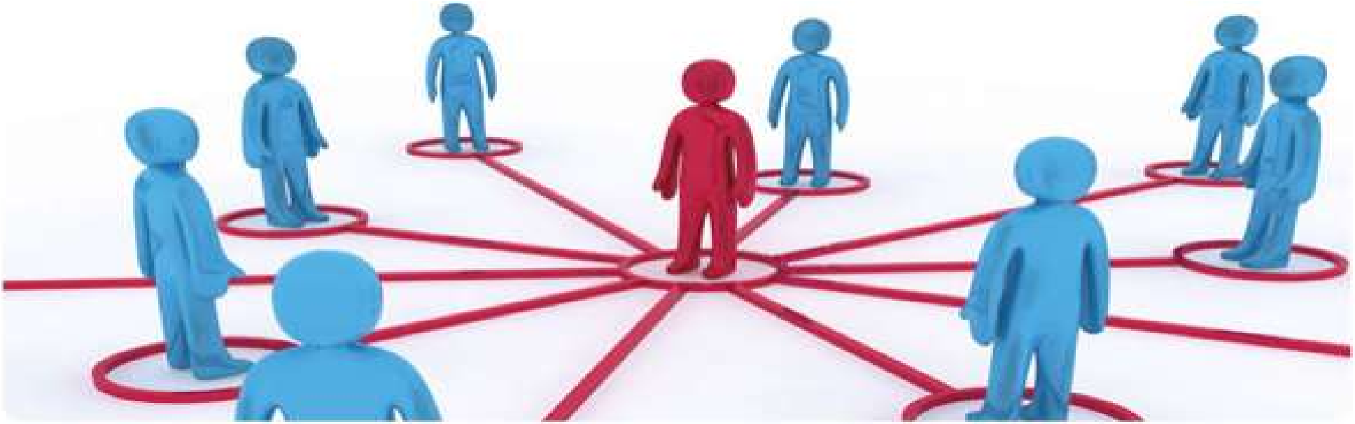
Görsel 2.5: Bireylerin çok sayıda sosyal statüleri vardır.

Her birey belirli bir zamanda ve hayatı boyunca aynı anda çok çeşitli statüler işgal etmektedir . Bireyin birden fazla statüye sahip olmasına statü dizisi denilmektedir. Bir kadın aynı zamanda anne, evlat, doktor ve eş olabilir.