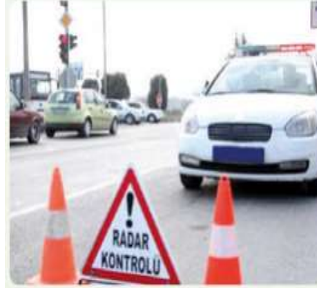
Sürücülerin hız sınırına uymaları beklenir.

Her toplumun sahip olduğu normların önem dereceleri farklılık gösterir. Bazı normlar bir toplumun devamlılığı için daha önemliken bazıları çok önemli olmayabilir. Örneğin kişinin yemek yerken ağzını şapırdatması veya arkadaşlarına kaba davranması önemli bir norm ihlali değildir. la belirlenir.