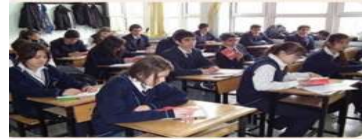
Okul, sosyalleşmenin gerçekleştiği en önemli alanlardandır.