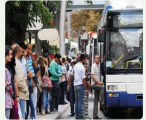
Yolcuların otobüse sırayla binmeleri beklenir.