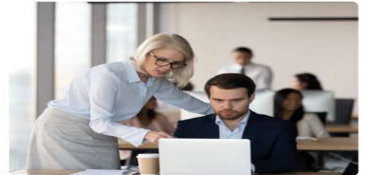
Görsel 2.7: Ebeveynlerin çalışma hayatı ve aile hayatlarında sahip oldukları roller kimi zaman çatışabilir.