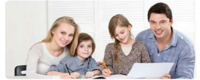
Görsel 2.6: Öğretmen olmak ebeveynlik rollerini kolaylaştırır.

Rol Çatışması Farklı sosyal statülere sahip olmak ve bu statülere ilişkin farklı rol ilişkilerini yürütmek roller arasında çatışma olasılığını arttırabilir. İki veya daha fazla statüdeki rollerin birbirini zorlaştırmasına rol çatışması denir. Örneğin çalıştığı yerde çocuğunun yöneticisi olan bir kişi ebeveynlik ve yöneticilik rolleri arasında çatışma yaşayabilir.