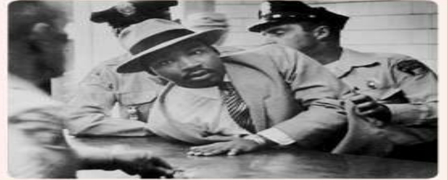
ABD’de M. L. King’in siyahilerin eşitlik hakları için mücadele ederken tutuklanması

Olumsuz sapma ise onaylanmayan, aşağı ve yetersiz davranış örüntüleri yönündeki sapmadır. Toplumsal hayat ve düzen için gereken hukuki ve ahlaki kurallara uymayan davranışlarda bulunmak, hırsızlık yapmak ve küfretmek olumsuz sapma örnekleridir. Sosyolojik çalışmalarda daha çok olumsuz sapma ile ilgili konular incelenmektedir.