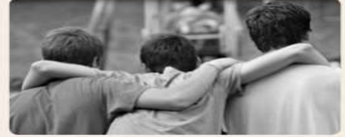
Arkadaşlık grupları sosyalleşmede çok etkilidir.

Kitle İletişim Araçları: Günümüz toplumlarında radyo, televizyon, İnternet ve özellikle sosyal medya sosyalleşme sürecini etkileyen güçlü unsurlar olarak öne çıkmaktadır. son dönemlerde medyanın, özellikle İnternet'in ve sosyal medyanın, bireyin sosyalleşmesindeki etkisi gitgide artmaktadır.