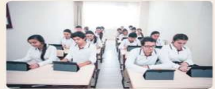
İnternet günümüzde sosyalleşmenin yeni bir boyutudur.